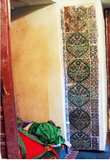
Resim 2: Güney cephe giriş açıklığının doğusundaki pano