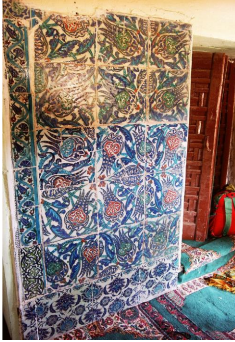
Resim 8: Doğu cephe, bugün mevcut olmayan çiniler