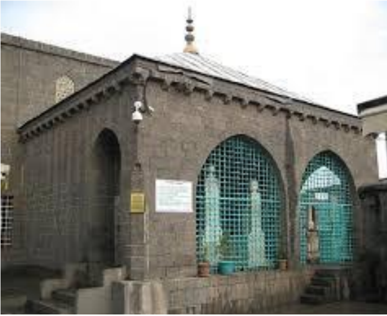
Resim 1: Kuzeybatıdan görünüş