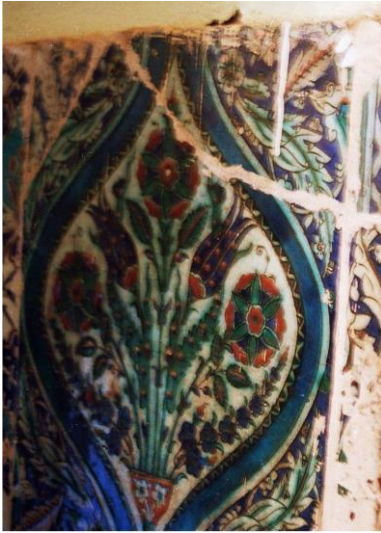
Resim 6: Batı cephedeki natürmorttan detay