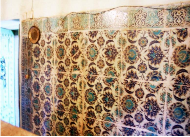
Resim 4: Güney cephe açıklığının batısındaki pano