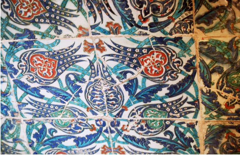
Resim 9: Doğu cephe, bugün mevcut olmayan çiniler, detay