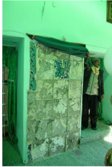
Resim 7: Doğu cephedeki çinilerin günümüzdeki durumu