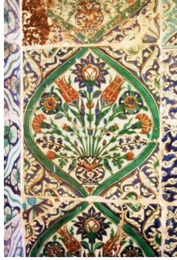
Resim 3: Güney cephe açıklığının doğusundaki pano, detay