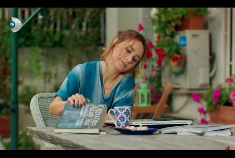
Resim 3: Kadraja Giren Oğuz Atay Kitapları (3. Bölüm, 0:30:54, 2015)

Bir diğer örnek olarak ise dizinin yine 3. bölümünde gerçekleşen başka bir sekans verilebilir. Uyuyakalan Poyraz'ı arayarak uyandıran Ayşegül, kendi evinin bahçesinde oturmaktadır. Poyraz ile telefon görüşmesi yaptıktan sonra Ayşegül, bahçedeki masanın üzerinde, üst üste duran üç kitaptan ortadaki kitabı alır. Ayşegül'ün ortadaki kitabı alırken kadraja giren en üstteki kitap ise bir Oğuz Atay kitabıdır. Ayşegül'ün eline aldığı ortadaki kitap ise Oğuz Atay'ın Tehlikeli Oyunlar romanıdır. Bu sekanstaki işaretleme de yalnızca Oğuz Atay'ın Tehlikeli Oyunlar romanına yapılmamıştır, aynı zamanda Ayşegül'ün Tehlikeli Oyunlar romanını alırken kadraja giren bir diğer Oğuz Atay kitabına da işaretleme yapılmıştır (3. Bölüm, 0:30:54, 2015).