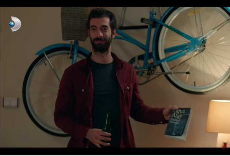
Resim 2: Tehlikeli Oyunlar Romanının Gösterilmesi (2. Bölüm, 0:58:37, 2015)

kopmuş olsaydı aramızda ve birçok söz yarım kalsaydı, birçok mesele çözüme bağlanmadan büyük bir öfke ve şiddet içinde ayrılmış olsaydık da yazmak, anlatmak, birbirini seven iki insan olarak konuşmak kaçınılmaz olsaydı. Sana, durup dururken yazmak zorunda kalmasaydım. Bütün meselelerden kaçtığım gibi uzaklaşmasaydım senden de. [...] (Atay,2017: s.385-388)