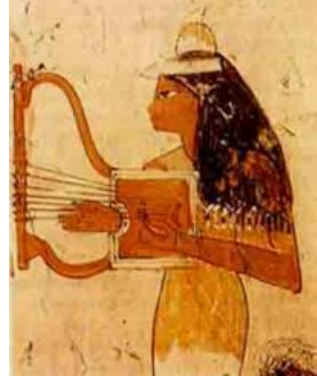
Şekil-2: Yatay Olarak Tutulan Lir