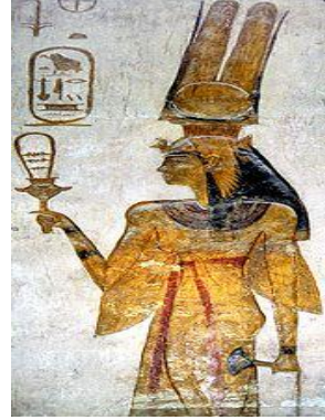
Şekil-4: Sistrum (en.wikipedia.org/wiki/Sistrum)