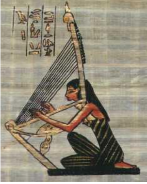
Şekil-1: On bir Telli Arp ( tarihpedia.com)